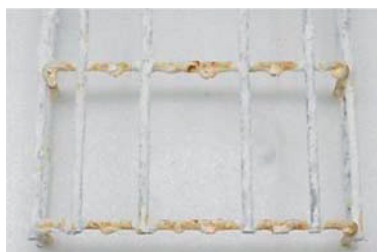
VFZ, 1050 h